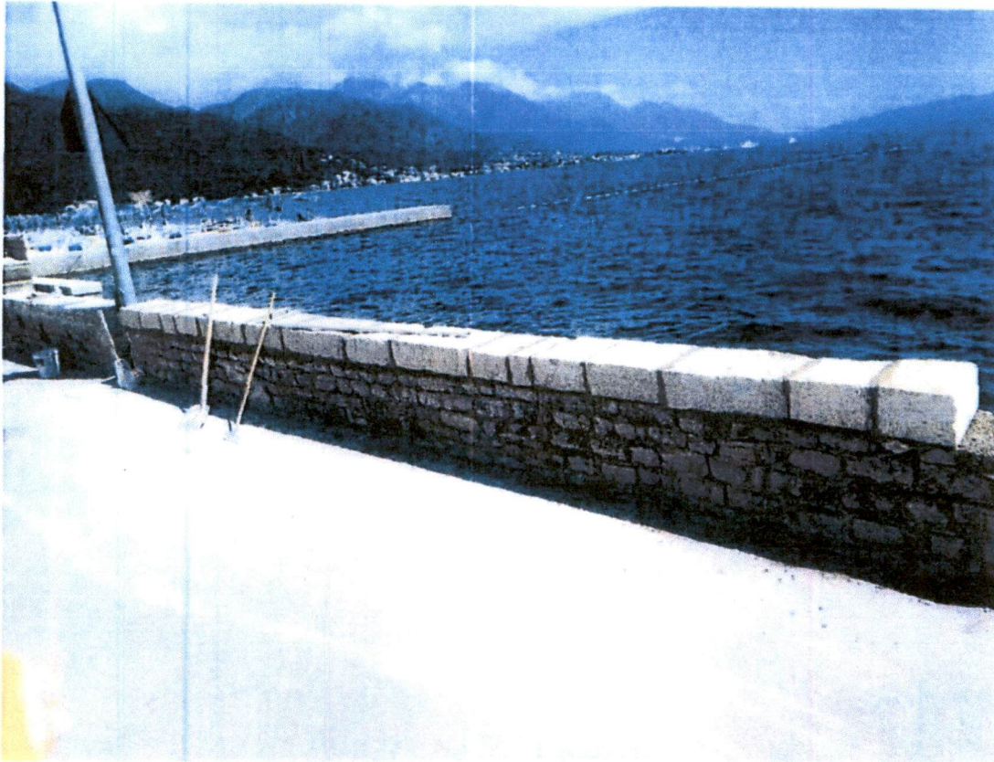
Sanacija parapetnog zida maj – jun 2022 godine