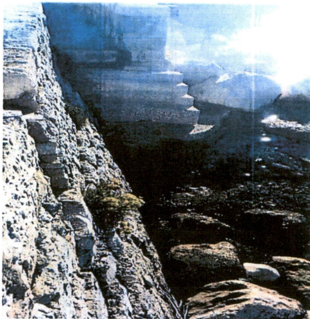
oštećeno betonsko stepenište