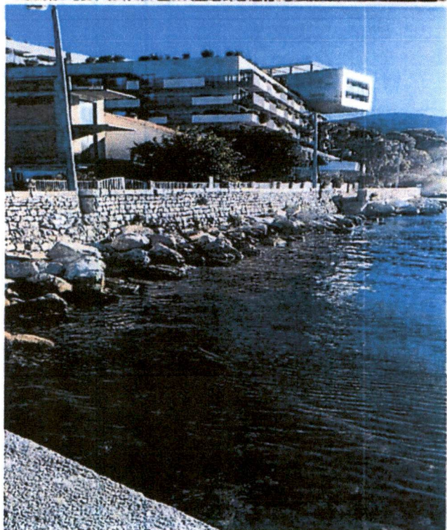
kameni nabačaj koji bi mogli pojačati